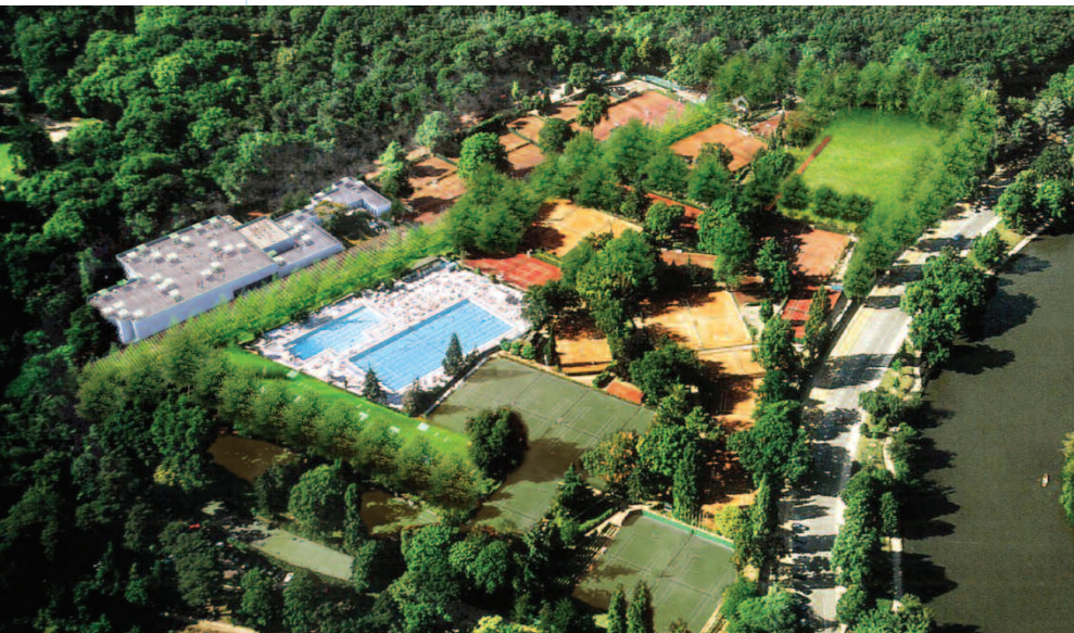
Nicolas Michelin & Associés

Depuis le départ, le nouveau concessionnaire de La Croix Catelan a affiché la volonté d'entreprendre un certain nombre de travaux dont voici un aperçu.